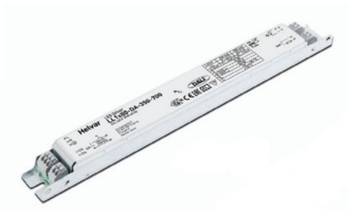
80W - SCHÉMA D'INSTALLATION